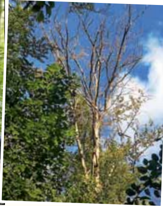
Erhebliche Ausfälle wegen Trockenheit stellen neue Anforderungen.