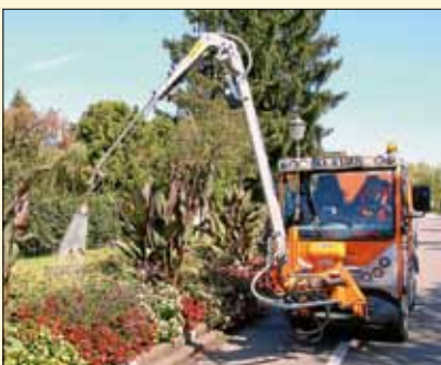
Der Fuhrpark unserer Bauhöfe wird sukzessive modernisiert.