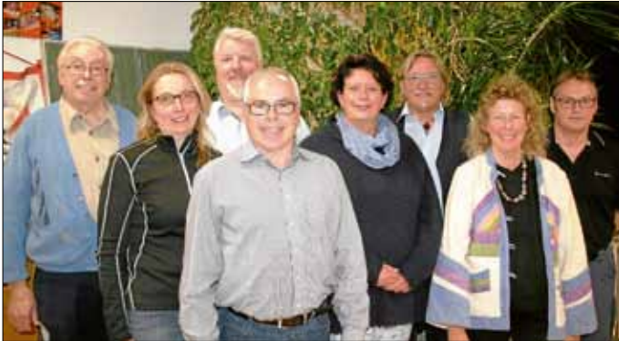
Die neu gewählte Vorstandschaft unserer Vereinsvereinigung Ortskartell Eggenstein-Leopoldshafen e.V.. Unsere Vereine fördern die Gemeinschaft.

Auf ehrenamtliche Arbeit kann das Gemeinwesen nicht verzichten.