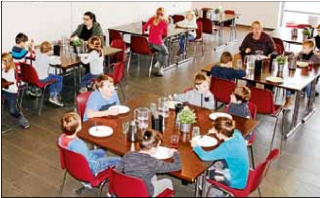
Hortkinder in der Hermann-Uebelhör-Halle beim Mittagessen. Kita-, Hortbeiträge und Essensgelder werden 2020 nicht erhöht.