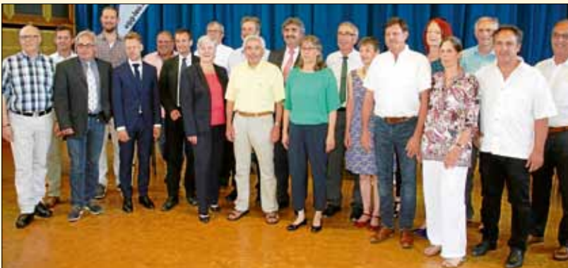
Im Mai wurden Gemeinderat und Kreistag bei den Kommunalwahlen auf 5 Jahre neu gewählt.