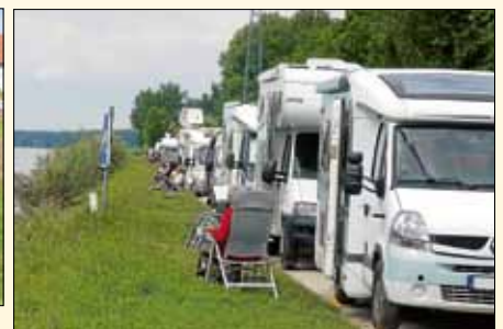
Natur genießen wollen viele, gerne mit ungehindertem Blick. Der Weg ist frei für Parkverbot auf der Wasserseite.