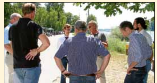
Wichtige Besprechung mit dem Wasserschiffahrtsamt Mannheim und der Verkehrsbehörde im Juli bei der Rheinfähre. Man versteht sich und kooperiert.