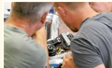
Das neue Reparatur-Café, sich engagieren, indem man anderen hilft.