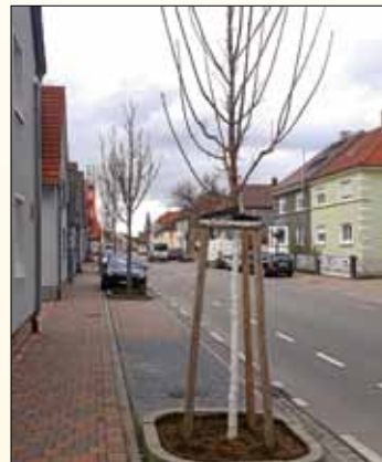
Wo Licht ist, ist auch Schatten. Der Baumsäger hat 2019 wieder zugeschlagen.