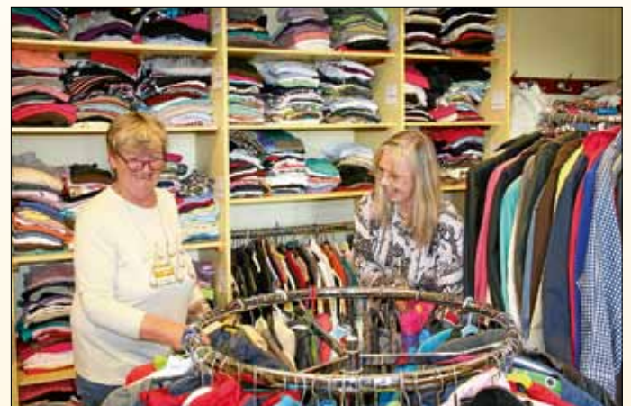
Unsere örtliche Flüchtlingshilfe leistet wichtige Integrationsarbeit und unterstützt in vielen Bereichen.