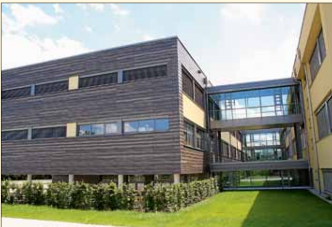
Die Gemeinschaftsschule mit Mensa ist fertig. In den Sommerferien 2020 wird das große Außengelände umgestaltet.