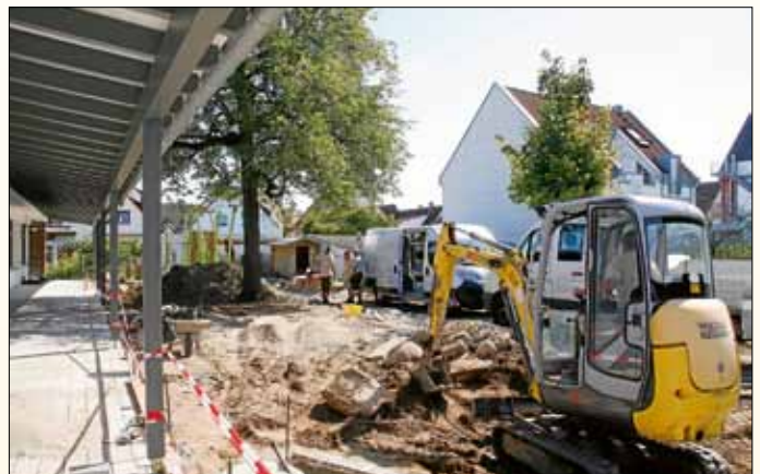
Dach, Fenster und Fassade der Kita an der Hauptstraße wurden energetisch saniert, das Außengelände abgeräumt sowie neu gepflastert, bepflanzt und tolle Spielgeräte aufgebaut.