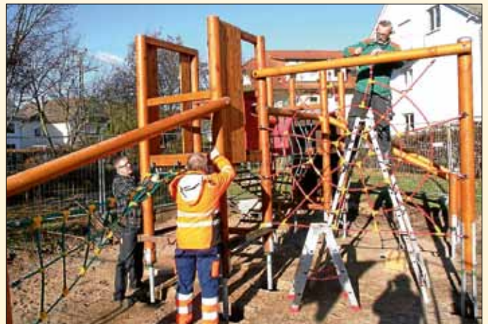
Bauhof, immer zu tun ...