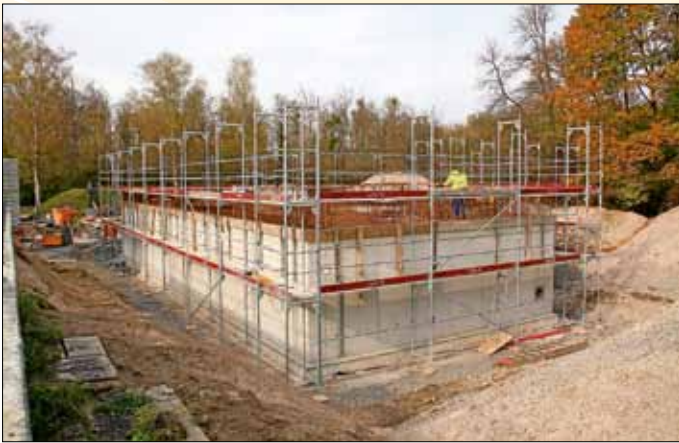
Neubau Wasserwerk Tiefgestade, ein 5-Millionen-Projekt.