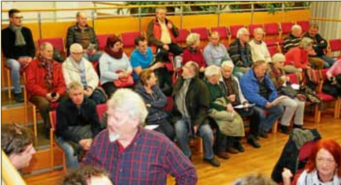
Einwohner erkundigten sich über die Pläne zur Erweiterung des Rathauses bei der Bürgerinformation im Januar.

Liebe Bürgerinnen und Bürger, unser Gemeindemotto „Wohlfühlen in Vielfalt“ ist Anspruch, Ziel und Weg zugleich. Gelebt werden kann es nur gemeinsam mit Ihnen.