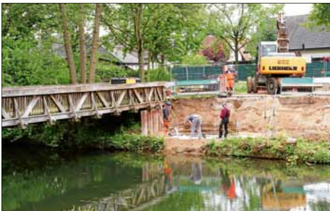
Der Holzsteg über den Pfinzentlastungskanal beim Bürgerpark wurde durch eine neue Stahlkonstruktion mit rutschfestem Belag ersetzt.