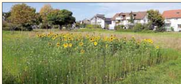
Insektenfreundliche Blühflächen wurden von der Agedagruppe Umwelt und auf deren Betreiben von der Gemeinde angelegt. Mitglieder der AGU bringen sich in die ökologische Weiterentwicklung des örtlichen Grünpflegekonzeptes ein.