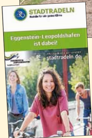
STADTRADELN auch in 2020 wieder. Auftakt am 28.06. bis 18.07.2020.