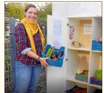
Privatinitiative gegen Lebensmittelverschwendung mit „Fairteilerschrank“ in der Bachstraße. Seit neuestem gibt es ein Reparatur-Café bei der Leobande.