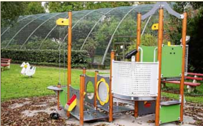
Die Gemeinde hat den Spielplatz im Vogelpark komplett erneuert. Am 28. Juni 2020 wird der Vogelpark 50 Jahre alt. Der Verein der Vogelfreunde ist dann schon 60.