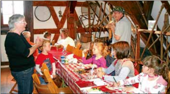
Verschiedene Gruppen in unserer Gemeinde unterstützen sich gegenseitig. Hier Leobande beim Museumsfest der AG Ortsgeschichte, bei welchem der Gesangverein Fidelia die Bewirtung übernommen hat. Rundum gelungen.