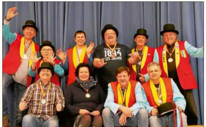
Das Faschingskomitee stellt sich der Herausforderung, unseren Faschingsumzug zu retten.