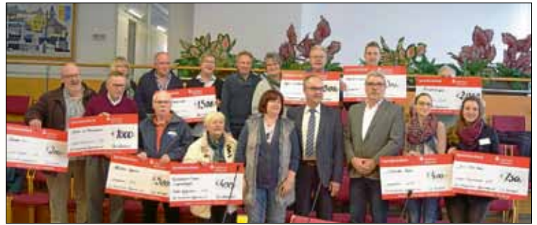
Der Freundeskreis Eggenstein hat seit 2004 über 86.000 € gespendet.