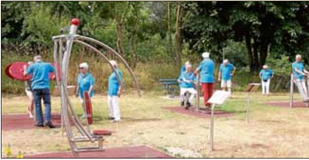
Der Generationensportpark im Bürgerpark entwickelt sich zur Begegnungsstätte.