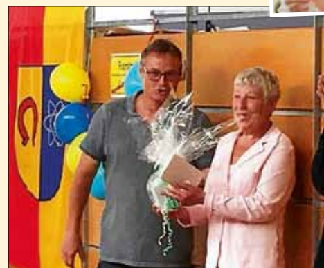
Verdiente Mitarbeiter verabschiedeten sich in den Ruhestand.