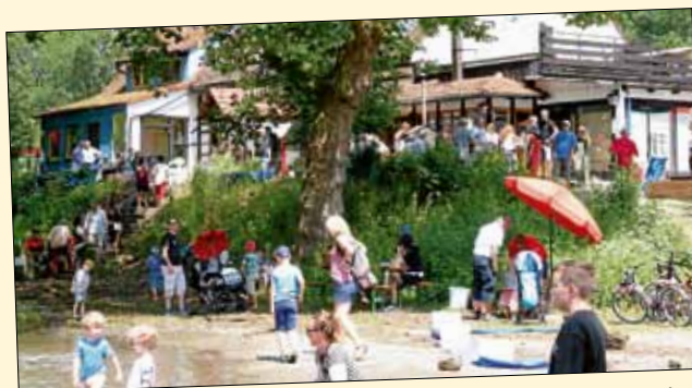
Fährfest beim PAMINA-Tag der AG Ortsgeschichte beim Pirat im Alten Hafen. Wohlfühlen in Natur.