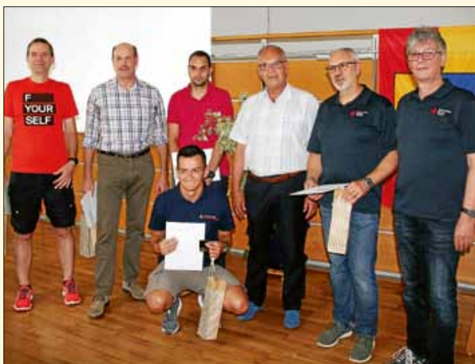
Blutspender engagieren sich für die Gemeinschaft. Hier die Ehrung einiger Dauerspender mit „runden“ Zahlen durch die Gemeindeverwaltung mit Vertretern unseres DRK-Ortsverbandes.