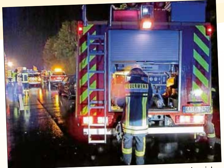
Unsere Feuerwehr ist Teil der Gemeindeverwaltung - ein wichtiges Ehrenamt.