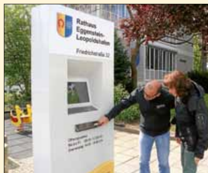
Neue Infosäule beim Rathaus.