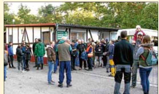
Jährliche Putzete für eine saubere Umwelt mit großer Bürgerbeteiligung, vor allem auch Jugendlicher.