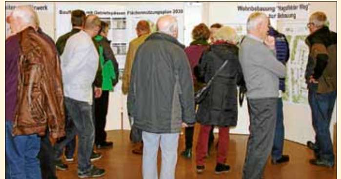
Insbesondere die Bauleitplanung und die in Planung befindlichen Projekte stießen auf großes Interesse beim Infomarkt der Einwohnerversammlung.