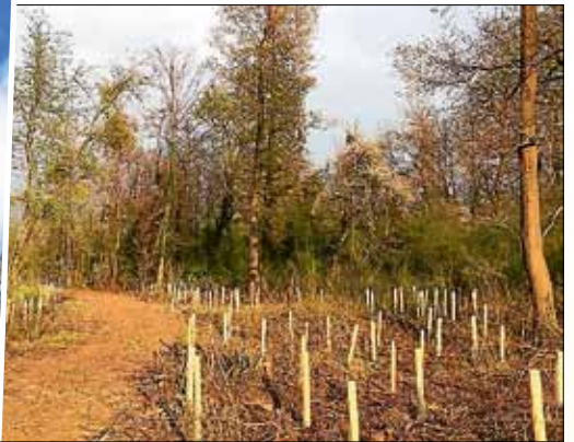
Neu gepflanzte Eichen bei der Dammsharte in Leopoldshafen werden mit Wuchshüllen vor Vertrocknung geschützt.