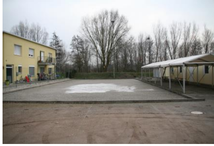
Boule-Platz in der Ottostraße 7