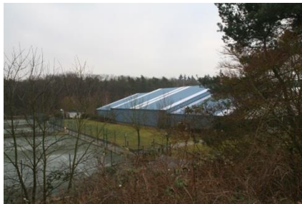
Tennishalle- und Plätze in der Linkenheimer Allee 1