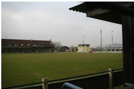
FC Alemannia im Sportplatzweg 13