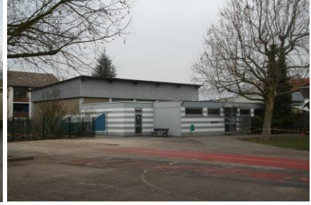
Gymnastikhalle der Lindenschule