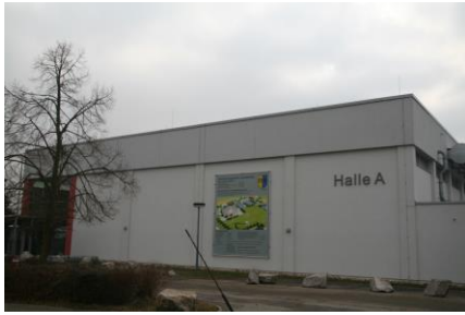
Sporthalle A im Buchheimer Weg 6