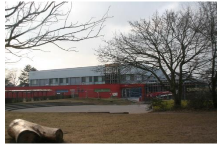
Herrmann-Übelhör-Halle im Nordring 9