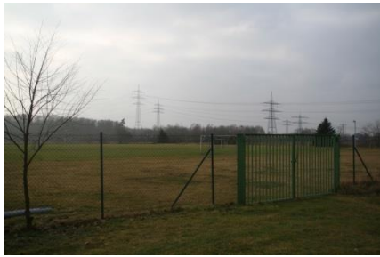
Fußballplatz am Forschungszentrum am Schröcker Tor