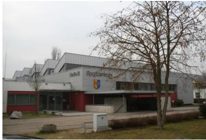
Sporthalle B im Buchheimer Weg 6