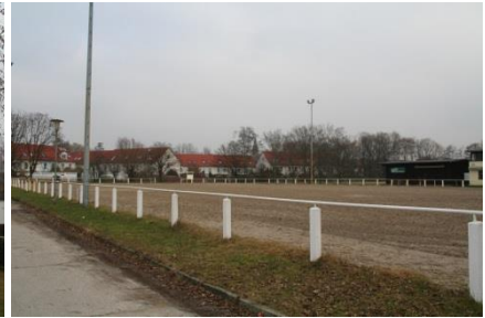
Reiterplatz in der Kruppstraße 2