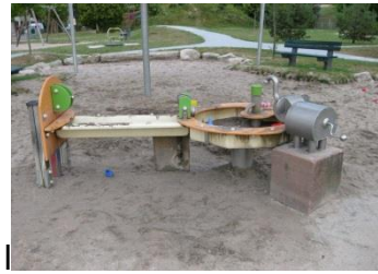
Spielplatz Brüsseler Ring