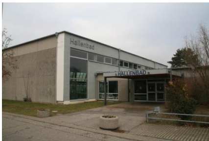
Hallenbad im Buchheimer Weg 1