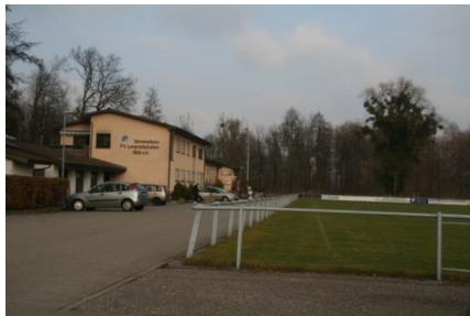
Sportplätze des FVL an der Höfleiner Straße 9