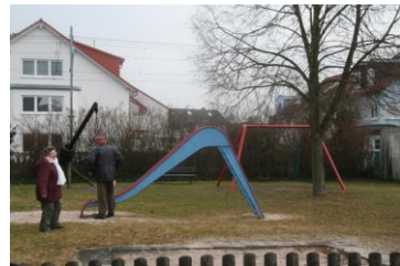
Spielplatz Eisenbahnstraße / Theodor-Körner-Straße