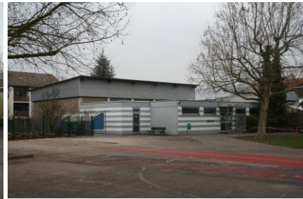
Gymnastikhalle der Lindenschule