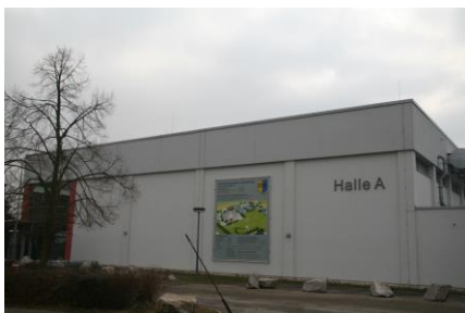
Sporthalle A im Buchheimer Weg 6