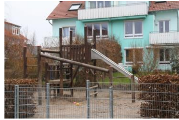
Spielplatz Ludwigstraße/ Raiffeisenstraße