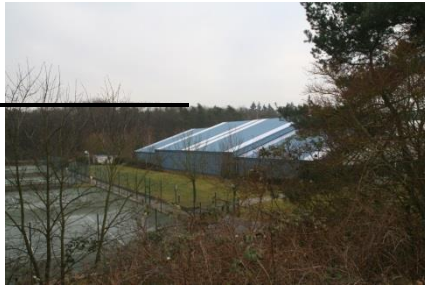
Tennishalle- und Plätze in der Linkenheimer Allee 1