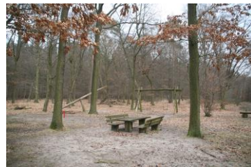
Waldspielplatz gegenüber vom FC Alemannia Eggenstein Linkenheimer Allee