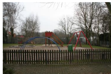
Spielplatz Hasebock / Hirtenberg