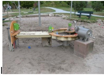
Spielplatz Brüsseler Ring