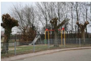
Spielplatz Eisenbahnstraße/ Tulpenstr.