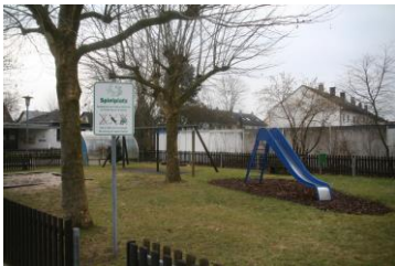
Spielplatz Eisenbahnstraße beim Kindergarten Malkasten