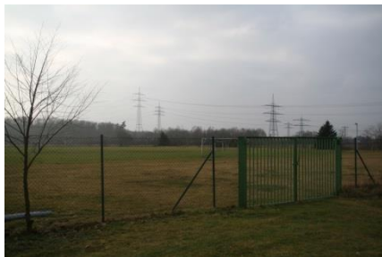
Fußballplatz am Forschungszentrum am Schröcker Tor

Zum Nachschauen finden Sie einen Ortsplan der Gemeinde Eggenstein-Leopoldshafen auf der Seite 35 oder auf der Homepage der Gemeinde unter www.egg-leo.de