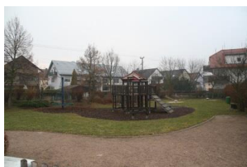
Spielplatz Magdeburger Ring