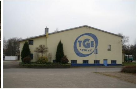
Turnhalle der Turngemeinde Eggenstein, Fisperweg 2