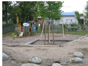
Spielplatz Schwarzwaldstraße/ Teil II