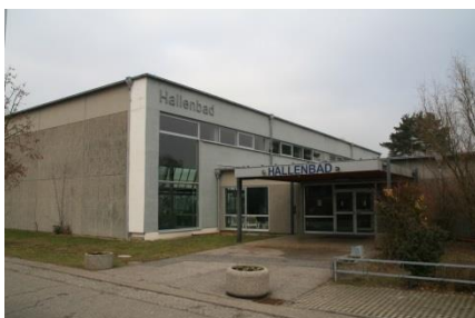
Hallenbad im Buchheimer Weg 1