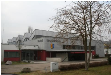
Sporthalle B im Buchheimer Weg 6