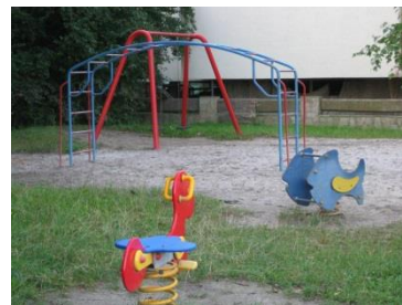
Spielplatz Rheinfähre beim Kiosk