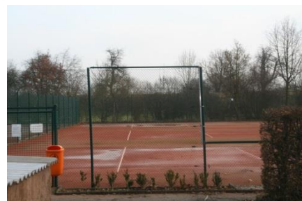
Tennisanlage an der Hafenstraße 1