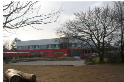
Herrmann-Übelhör-Halle im Nordring 9