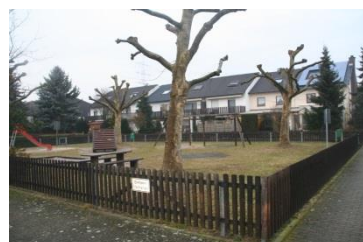
Spielplatz Haydnstraße/ Schubertstraße