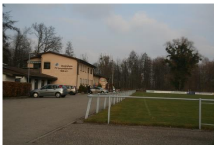
Sportplätze des FVL an der Höfleiner Straße 9