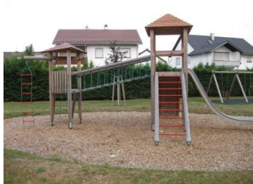
Spielplatz Schwarzwaldstraße/ Teil I