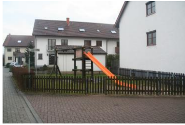
Spielplatz Jahnstraße/ Zanderweg