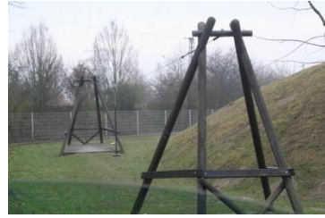
Spielplatz Donauring beim Bürgerpark