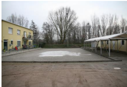
Boule-Platz in der Ottostraße 7