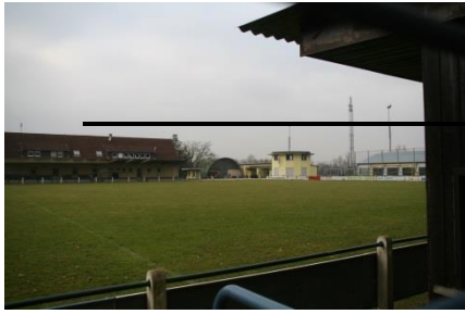
FC Alemannia im Sportplatzweg 13