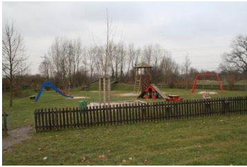
Spielplatz an der Turnhalle Fisperweg