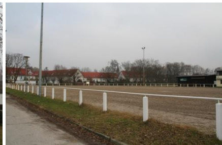
Reiterplatz in der Kruppstraße 2